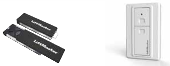
LM60EVS leveres med 2 stk 2 kanals fjernkontroller med 3-band 868 MHz og 1 stk 128 EV trådløs innvendig veggbytter.